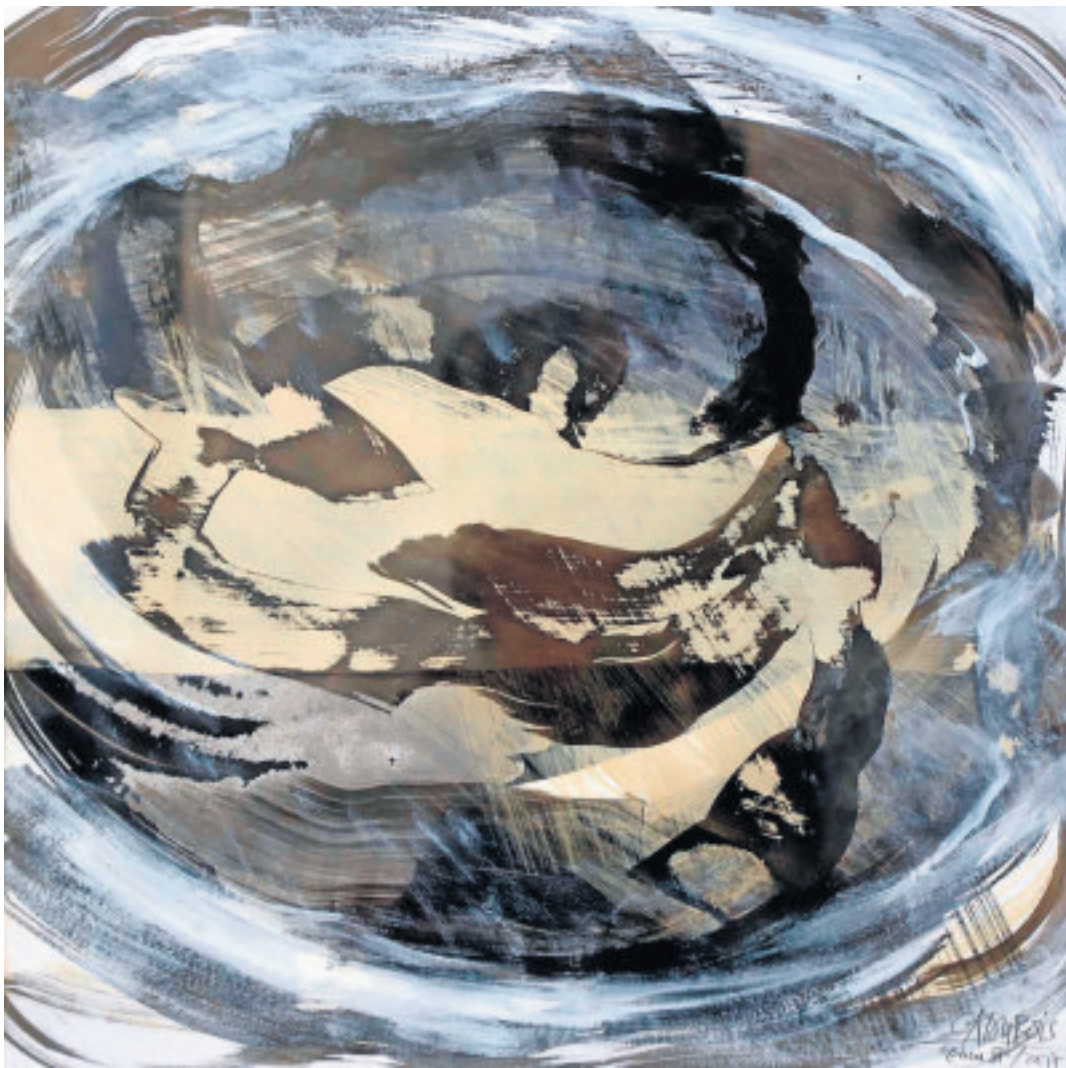
Encre VI, 2017, encre et acrylique sur papier, 50 x 50 cm.