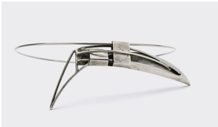
Giorgio Veralli Sans titre, non daté (vers 1970) Pendentif [P.U.] Argent Collection privée